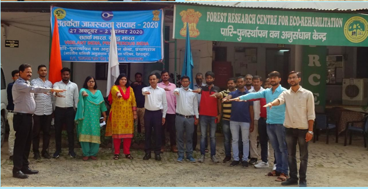
Observance of Vigilance Awareness Week-2020: Report compiled by Extension Officer-In-Charge Page 4