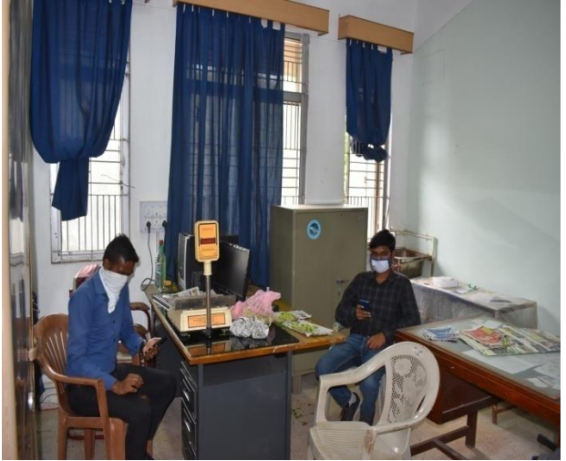
विश्व पर्यावरण दिवस का आभासी यथार्थ/ उपस्थिती (Webinar) के माध्यम से कार्यक्रम की झलकियाँ