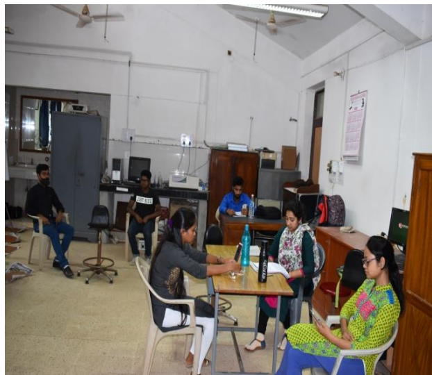
विश्व पर्यावरण दिवस का आभासी यथार्थ/ उपस्थिती (Webinar) के माध्यम से कार्यक्रम की झलकियाँ