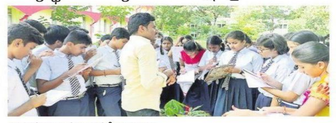
అవగాహన కర్ఫిస్తున్న శాస్త్రవేత్తల బృందం

వర్గల్: వర్గల్ మండలంలోని నవోదయ విద్యా ర్థులకు పర్యావరణ పరిరక్షణపై శాస్త్రవేత్తల బృందం అవగాహన కల్పించారు. భారతీయ అటవీ పరిశోధన, శిక్షణ మండలి(ఐసీఎఫ్ఆర్ ఈ) ఆధ్వర్యంలో నవోదయ, కేంద్రీయ పాఠ శాల విద్యార్థులకు 'ప్రకృతి' అనే అంశంపై అవ గాహన కల్పించేందుకు శ్రీకారం చుట్టారు. ఇందులో భాగంగా ఐసీఎఫ్ఆర్ఈ ప్రాంతీయ