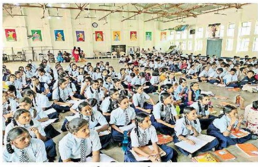
కార్యక్రమంలో పాల్గొన్న నవోదయ విద్యార్థులు

కల్పించారు. ఈ సందర్భంగా వారు మాట్లాడుతూ ప్రకృతిని కాపాడుకోవాల్సిన బాధ్యత మనందరిపై ఉందన్నారు. ప్రకృతిలో మమేకమైనటువంటి గాలి, నీరు, భూమి, ఆకాశం, పర్యావరణం అడవులు, వివిధ జీవరాసులను కలిపితే చక్కటి జీవవైవిధ్యం అవుతుందని తెలిపారు. పర్యావరణంపై అవగాహన కల్పించడానికి భారతీయ అటపీ పరిశోధన శిక్షణా మండలి నపోదయ మరియు కేంద్రీయ పాఠశాల విద్యార్థులకు అవగాహన కల్పించుటకు ప్రకృతి అనే కార్యక్రమానికి శ్రీకారం చుట్టారన్నారు. ఈ ఒప్పందం ప్రకారం ఐసీఎఫ్ఆర్ఈ ప్రాంతీయ పరిశోధన సంస్థలో ఒక్కడైన హైదాబాద్కు చెందిన కేంద్ర అటపీ జీవ వైవిధ్య సంస్థ ఐఎఫ్బి అనేక అంశాలపై పరిశోధనలు జరుపుతున్నారన్నారు.