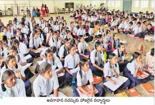
ప్రకృతితో మమేకం కావాలి

HANS INDIA Wed, 28 August 2019 https://epaper.thehansindia.com/c/42958176