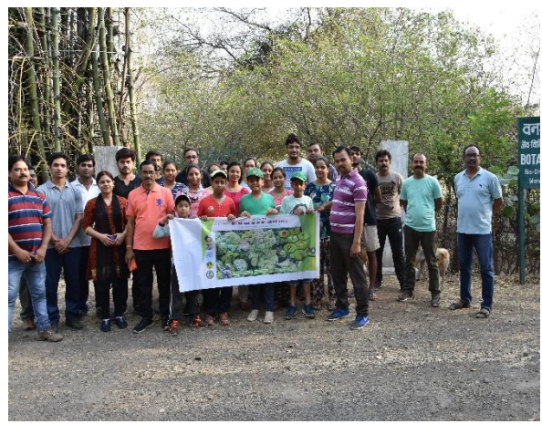
To acquaint with biological diversity, childern and staff participated in Nature walk to TFRI botanical garden