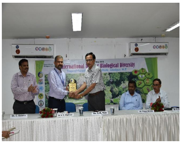
Celebration concluded with presenting souveneir to the guests