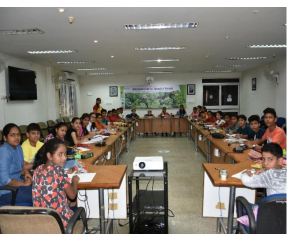
Painting competition held during International day of biological diversity at TFRI, Jabalpur