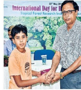
बाँस, पौधों और पश्चियों की जबलपर एक तरफ तो चित्रकला में भी प्रकृति के विविध रंग उकेरे। अवसर था