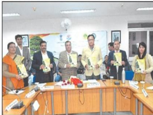
Guests releasing course manual during training programme.