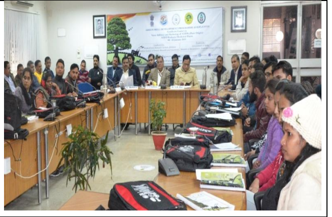
Lectures by resource persons and scientists during technical sessions