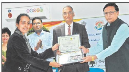
Guests distributing certificates to participants of Green Skill Development Programme.

Besides, the trainees were exposed to Forest Research Centre-Skill Development, Chhindwara for preparation of Mahua and Munga based products, MP Vigyan Sabha's processing unit of honey, multi grain products, mahua based bakery products, char and aonla based