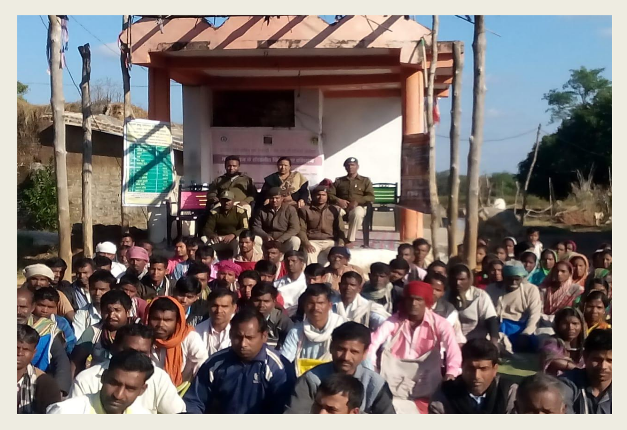
A view of group of participants during the event on 18<sup>th</sup> December,2018 at Tumditola,Amagad,Seoni.