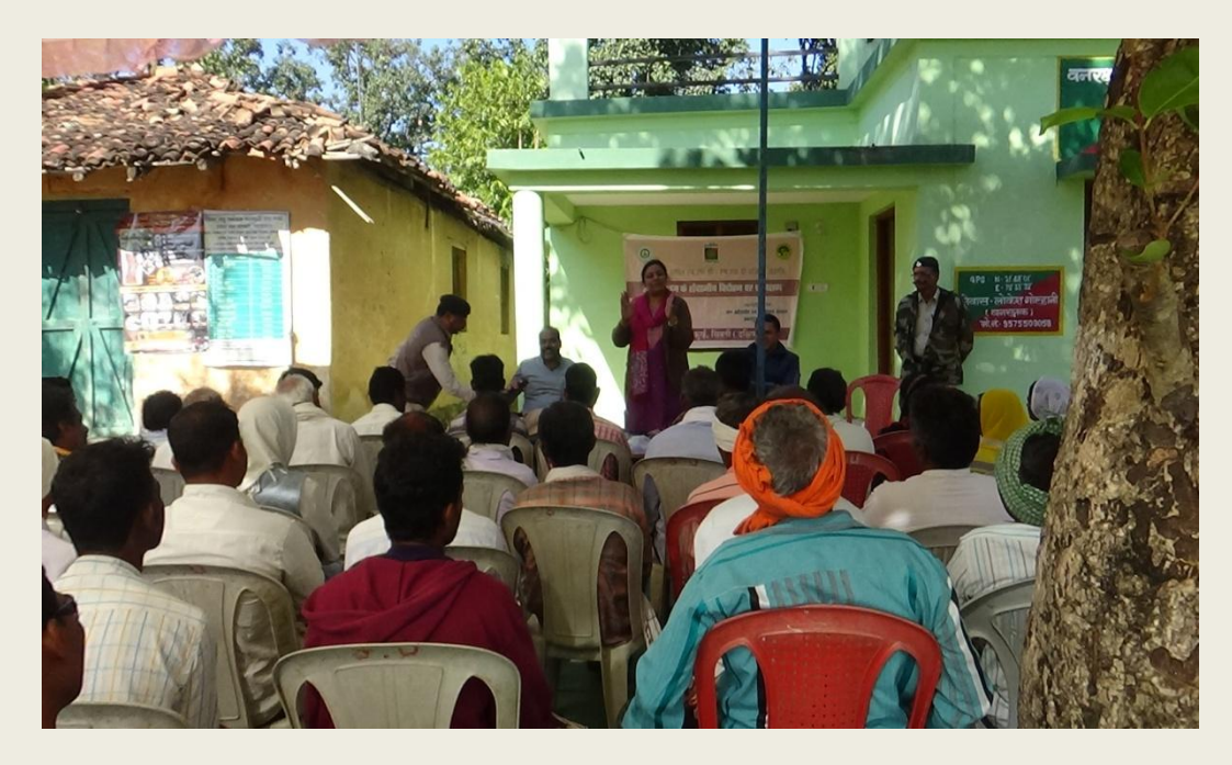
Interaction with the tribals during the session at Khawasa range of Seoni.