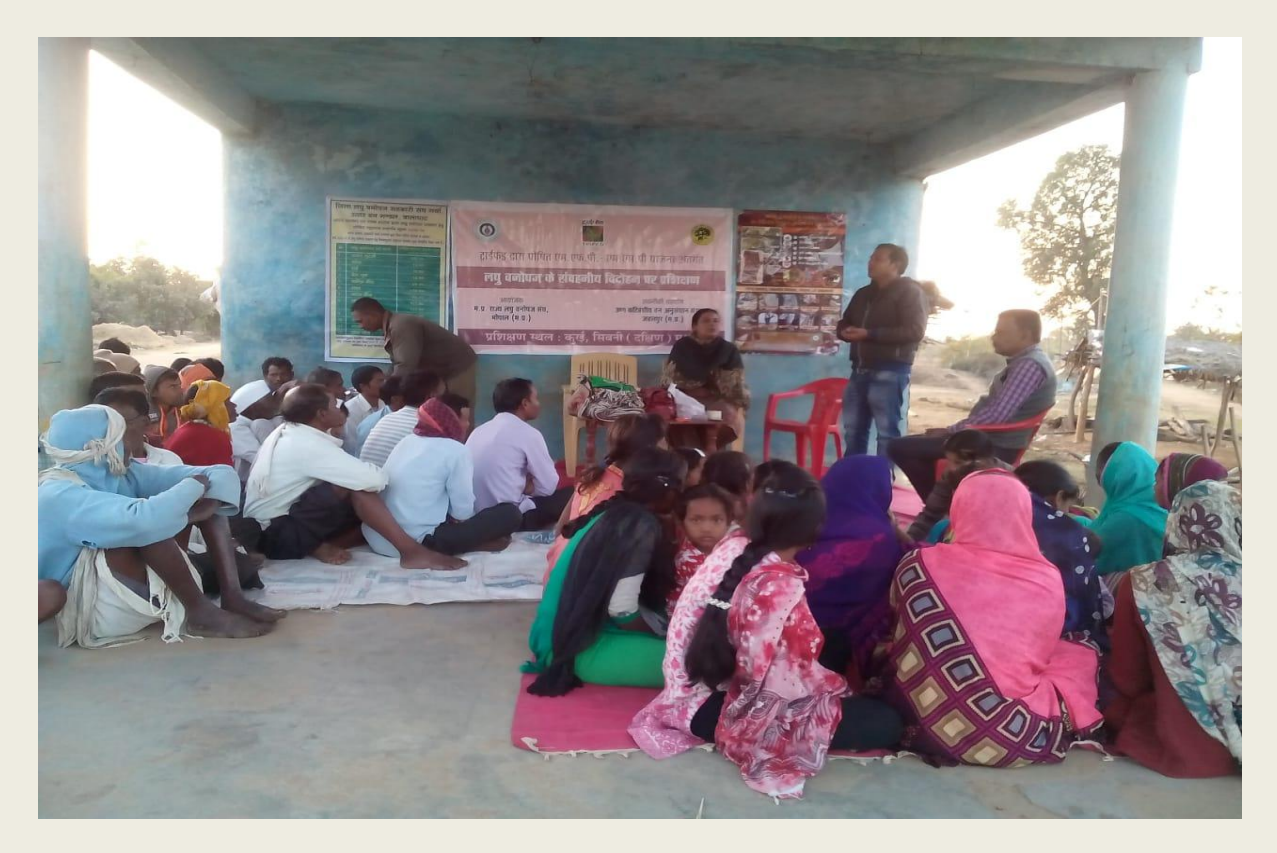
A group of participants of Dungariya of Barghat range of seoni