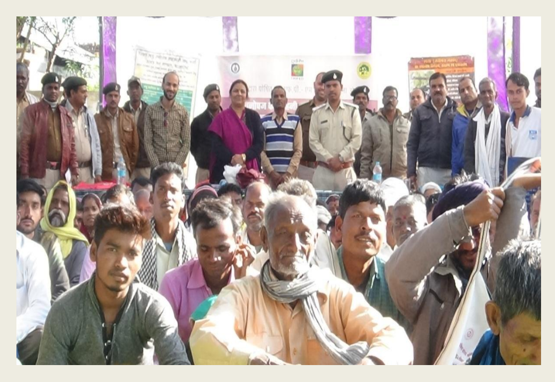
A group of participants of Bandol range of Seoni (South) during the event .