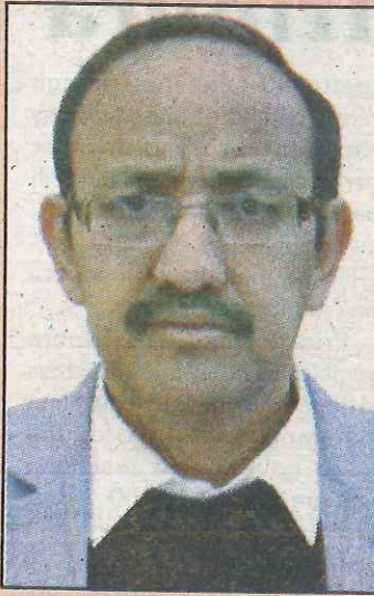
Degrees in Physics and Forestry.