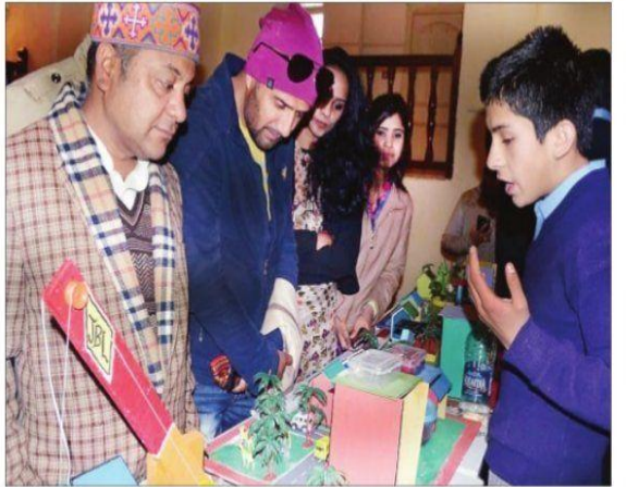
शिमला : गेयटी थियेटर में आयोजित प्रदर्शनी के दौरान बच्चों द्वारा बनाए गए मॉडल्स को देखते मुख्यातिथि व (दाएं) स्टाल में जानकारी लेते बच्चे।