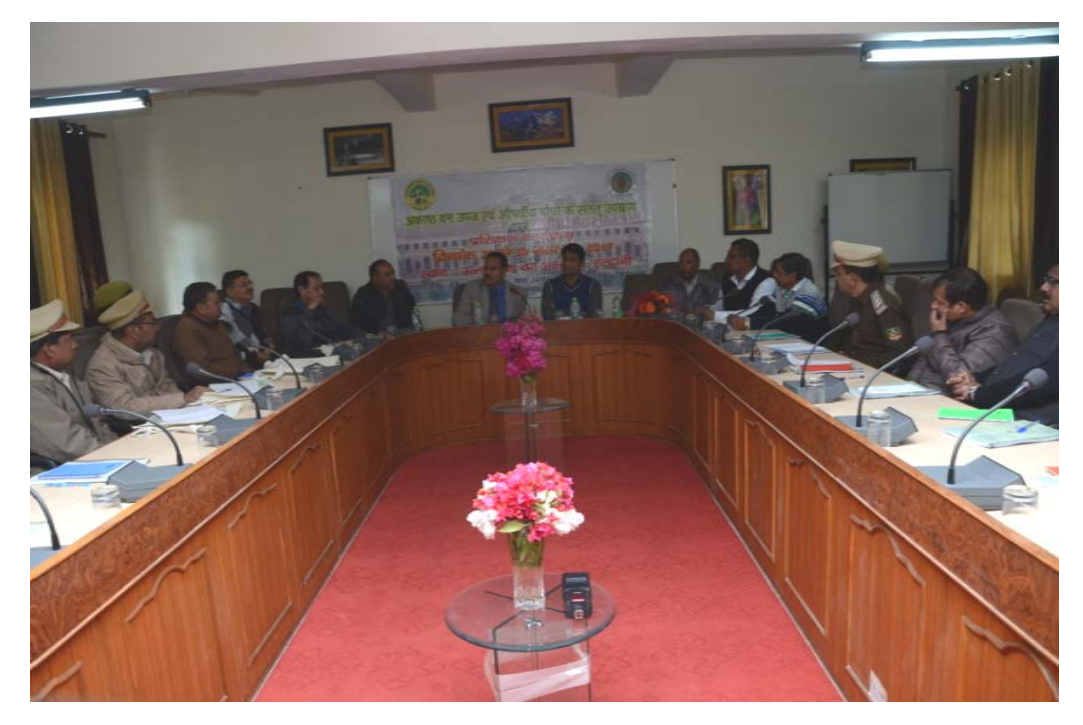
Interaction with trainees