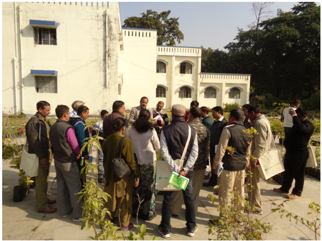
Subject specialist interacting with trainees in field