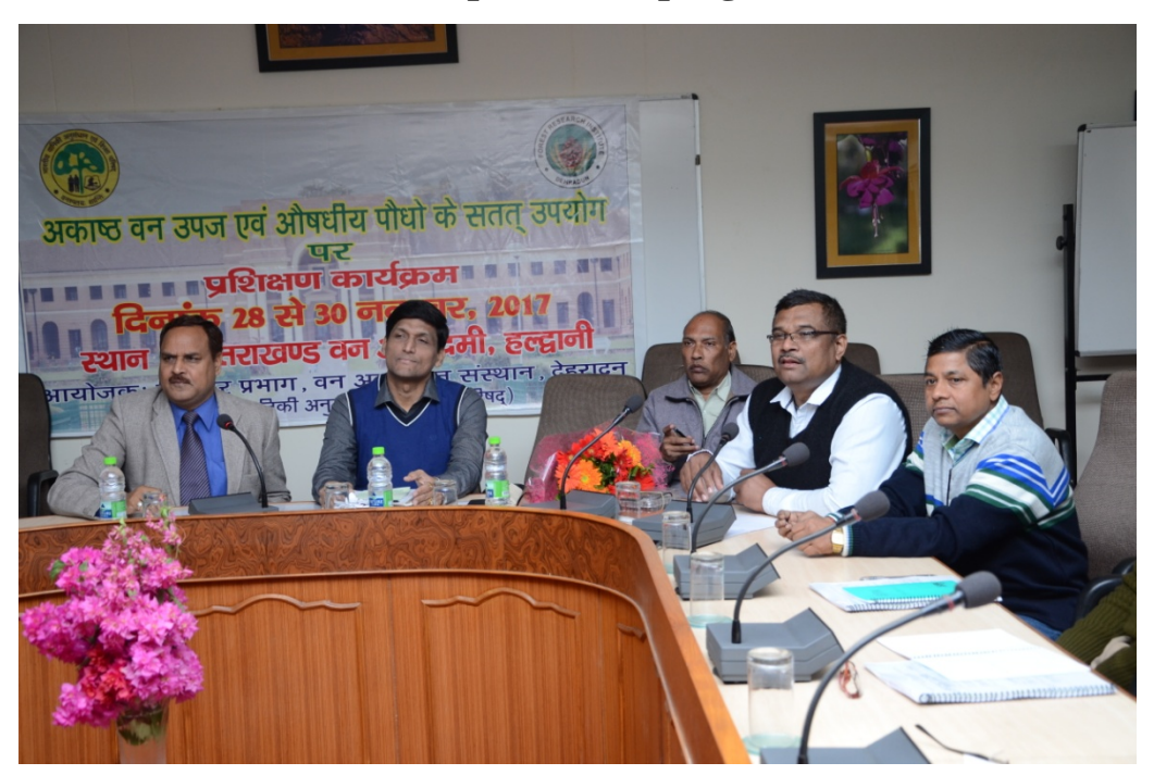
Chief Guest and faculty