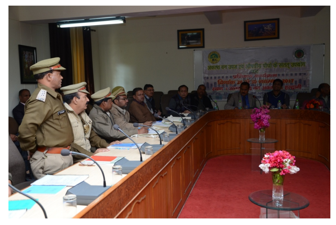
Trainee expressing his views