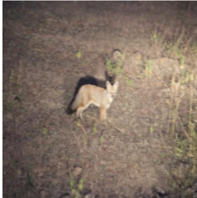
लोमडी (Indian Fox)

माहुलपत्ता ( Bauhinia vahlii , W. & A.) आदि की उपस्थिति भी देखी जा सकती है। औषधीय पौधों की अनेक प्रजातियाँ भी यहाँ पायी जाती हैं, जिनमें से प्रमुख काली मूसली ( Curculigo orchioides ), वन हल्दी ( Curcuma aromatica ), कालमेघ ( Andrographis paniculata ) आदि हैं तथा झाड़ियों में करोंदा ( Carissa carandas L.), और लेंताना ( Lantana camara ) प्रमुख रूप से यहाँ पाये जाते हैं। प्राकृतिक तौर पर मौजूद वनों के साथ ही साथ वन विभाग के द्वारा भी समय – समय पर किया जाने वाला वृक्षारोपण तथा वनों का रख – रखाव भी इस वन क्षेत्र को और भी समृद्ध व हरा – भरा बनाता है। वन्य प्राणियों के रूप में यहाँ हिरण, सियार, जंगली शूकर, बंदर तथा खरगोश आदि के साथ – साथ अनेक छोटे जीव जंतु भी पाये जाते हैं। आस – पास के ग्रामीणों के अनुसार संलग्न घने वन क्षेत्रों से आकर कभी – कभी तेंदुआ जैसे बड़े माँसाहारी जीव भी इस जंगल में विचरण करते पाये जाते हैं। इस वनक्षेत्र में विभिन्न प्रकार के वन्य प्राणियों की उपस्थिति यहाँ के वनों की समृद्धि को सिद्ध करती है।