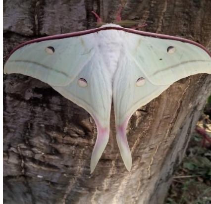
भारतीय मून मोथ