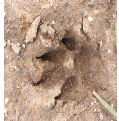
वन्य प्राणियों के पद चिन्ह

ग्रीष्मकाल में कुछ दुर्लभ जंतु जैसे - पेड की छछूंदर (Tree Shrew), काँटेदार शेही (Porcupine) व