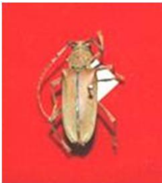
Fig. 2. Babul borer beetle, Celosterna scabrator

C. scabrator is highly polyphagous and other species attacked include Acacia catechu , Cassia siamea , Casuarina equisetifolia , Dipterocarpus alatus , Eucalyptus spp., Morus alba , Pithecolobium dulce , Prosopis cineraria , P. juliflora , Shorea robusta , Tamarix indica , Tectona grandis , Terminalia chebula and Zizyphus jujuba (Stebbing, 1914; Beeson, 1941; Browne, 1968; Chatterjee and Singh, 1968; Jain, 1996).