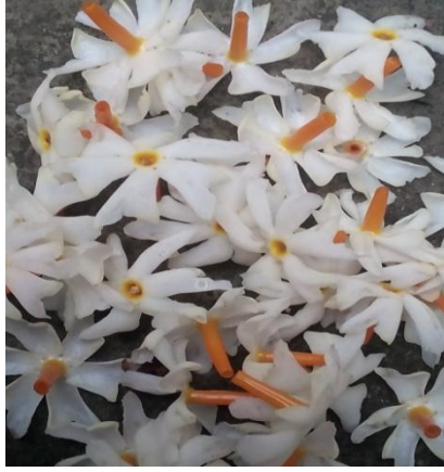
पारीजात के पुष्प

अलावा पुष्पीय पौधो कुछ किस्मे जैसे – पारीजात या हरसिंगार ( Nyctanthes arbor-tristis L.), कचनार ( Bauhinia variegata , Linn.), सेमल ( Bombax ceiba L.)