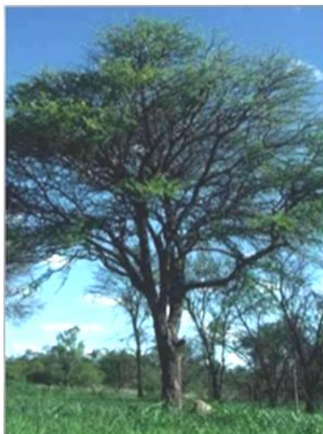
Fig.1. Babul tree, Acacia nilotica