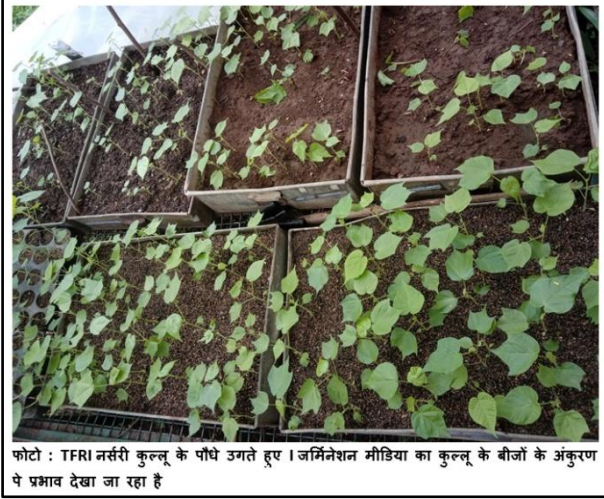
फोटो : TFRRI नर्सरी कुल्लू के पौधे उगते हुए। जर्मिनेशन मीडिया का कुल्लू के बीजों के अंकुरण पर प्रभाव देखा जा रहा है

योग्य प्रजाति है। इसीलिए बंजर और पहाड़ी इलाकों में इसका वृक्षारोपण करना चाहिए, ताकि बंजर और पहाड़ी इलाके हरे भरे हो सके और गोंद के उत्पादन के माध्यम से आर्थिक फायदा भी लोगों को मिलेगा।