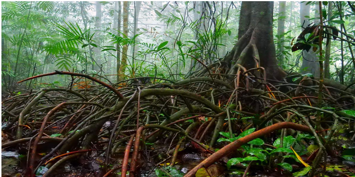
Myristica swamps recently discovered in Maharashtra

This existing small, critically endangered ecosystem is in a highly disturbed condition due to anthropogenic intervention. Most of them were converted into paddy fields, rubber estates, areca-nut orchards and teak plantations or submerged under dams and irrigation projects or exterminated by fires set on by the shifting cultivators. Most of them have also been destroyed under various forestry operations. According to a GIS study done by Priti et al in 2016 8 that examined the impact of climate change on the distribution of five species of Myristicaceae in 2050 to 2080, it was predicted that both species i.e. Gymnocranthera canarica and Myristica fatua —will experience a reduced overall suitable habitat area. While G. canaria is estimated to drop by 1.04 percent in current area, M. fatua will contract by 1.68 percent under a scenario of rapid economic and population growth till half-century with a balance in fossil and non-fossil energy sources.