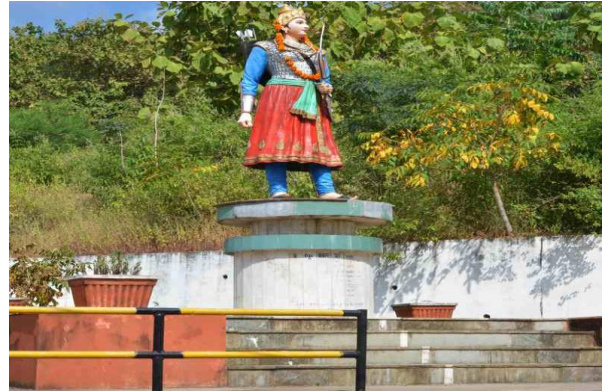
वीरांगना महारानी दुर्गावती समाधी स्थल ( https://jabalpur tourism.in/exploreDistrict )