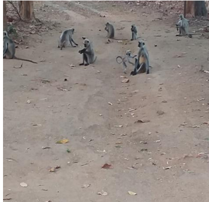
लंगूर (Grey Langur)