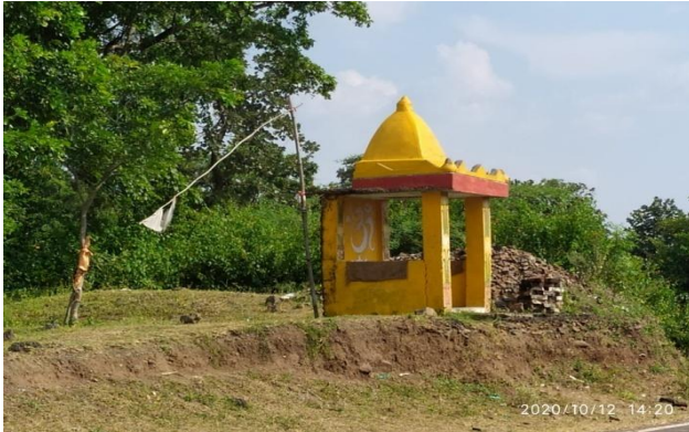
लोक देवता बघ्यराज

या आवागमन, ग्रामीण बिना जंगल को नुकसान पहुँचाये वन के बाहरी इलाकों से अपनी जरूरतों को पूरा कर लेते हैं। बारहा के निकट ही समाधी नामक गाँव है, जो की गोंडवाना राज्य की महान वीरांगना महारानी दुर्गावती की निर्वाण स्थली है। पर्यटक जब भी यहाँ आते हैं, तो वे इस ऐतिहासिक तथा प्राकृतिक स्थल को देखकर अभीभूत हो उठते हैं। बढ़ता शहरीकरण व शहरी इलाकों के आस-पास इस प्रकार के वन क्षेत्र देखना अब दुर्लभ हो गया है। इस प्रकार के दुर्लभ वन्य सम्पदा वाले इलाकों की सुरक्षा न केवल वन विभाग वरन् जन सामान्य की भी समान भागीदारी निहित होनी चाहिये जिससे यह सुन्दर प्राकृतिक परिआवास इसी तरह सुरक्षित बना रहें।