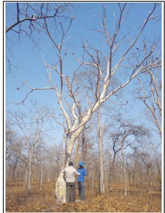
फोटो: कुल्लू वृक्ष से डेटा रिकॉर्ड करते TFR। टीम के सदस्य, नर्मदा नगर रेंज, खंडवा वन विभाग, मध्य प्रदेश

भारत, श्रीलंका एवं बर्मा में कुल्लू पाया जाता है। भारतवर्ष यह मध्यप्रदेश, छत्तीसगढ़, महाराष्ट्र, उड़ीसा, आंध्रप्रदेश, बिहार, गुजरात के जंगलों में