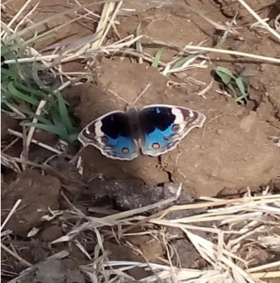
ब्लू पेन्सी तितली