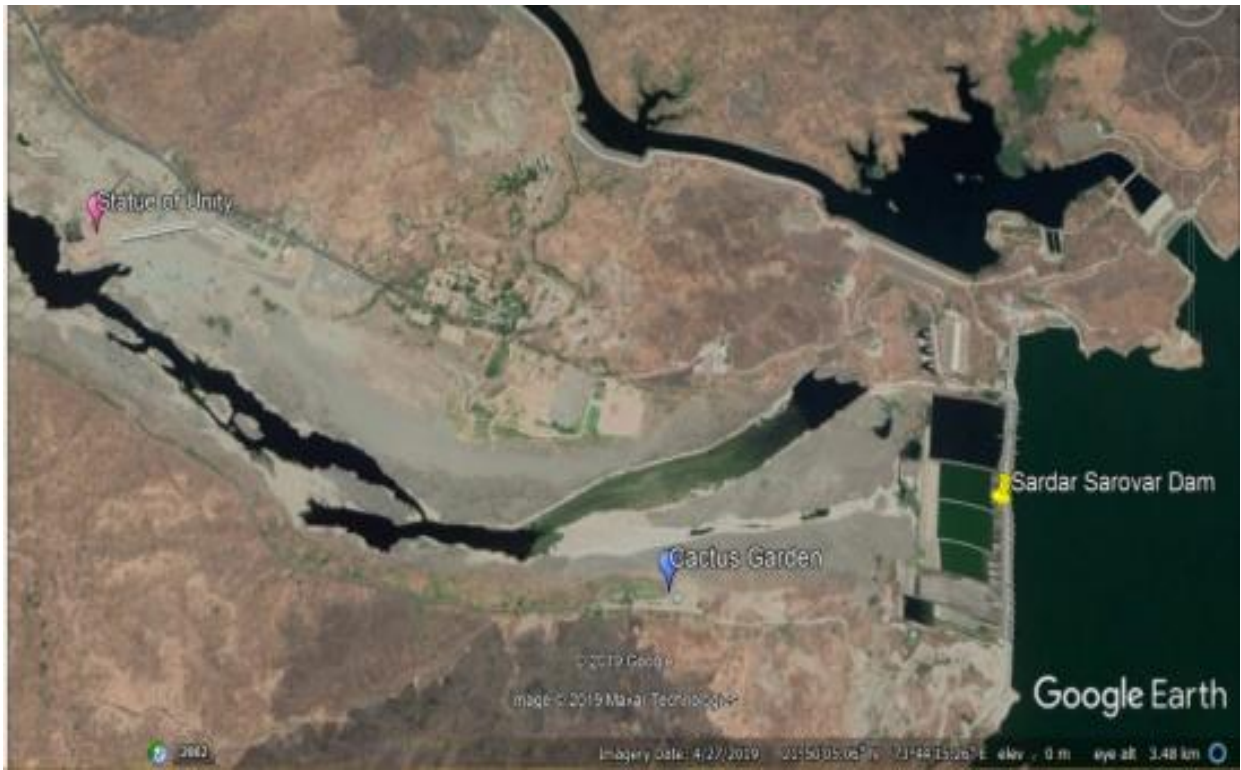
Aerial view