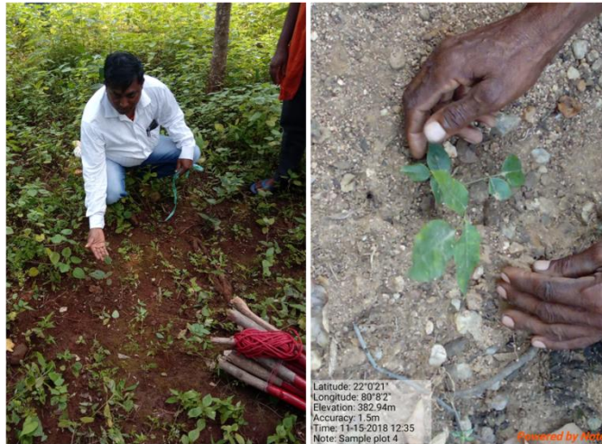
मध्य प्रदेश के जंगलों में बीजासाल के नेचुरल रिजनरेशन का आकलन करते हुए TFRRI संस्थान, जबलपुर के कर्मचारी

रिसर्च संस्थानों, वन विभागों के प्रयासों के साथ ही जन भागीदारी की भी बहुत जरूरत है। फारेस्ट फ्रिजेस में रह रहे लोगों को इस प्रजाति के बारे में सजग करना चाहिए। साथ ही इस प्रजाति के कटाई पर कुछ वर्षों के लिए प्रतिबद्ध लगा देना चाहिए। सभी स्टैकहोल्डर्स के सामायिक प्रयासों से इस प्रजाति को बचाया जा सकता है।