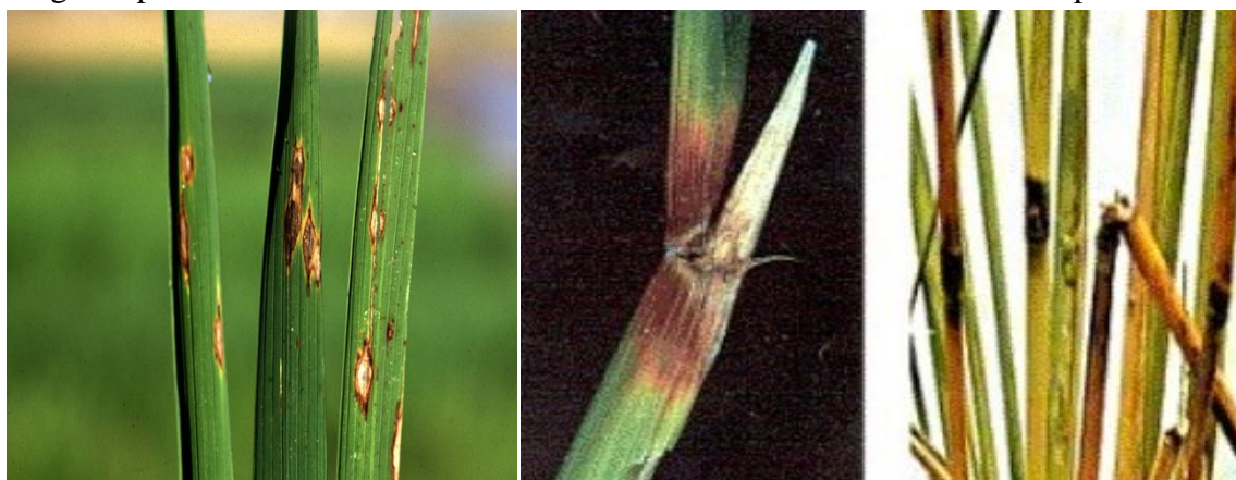
Fig 1: (a) Leaf blast

cases of leaf blast entire crop gives a burnt appearance in the field, hence known as "BLAST" disease. Neck blast appears on the neck region of panicle which develops a black colour and shrivels completely or partially and panicle breaks at the neck and hangs. In the cases of nodal blast nodes become black and break up.