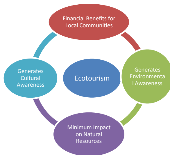
Fig1. Components of Ecotourism

The destination has an infectious calm vibe which makes it perfect and unique to learn various facets of environment conservation. Aesthetically the place has been designed to attract the visitors where on one side a view of sardar sarovar dam is there alongside of river Narmada.