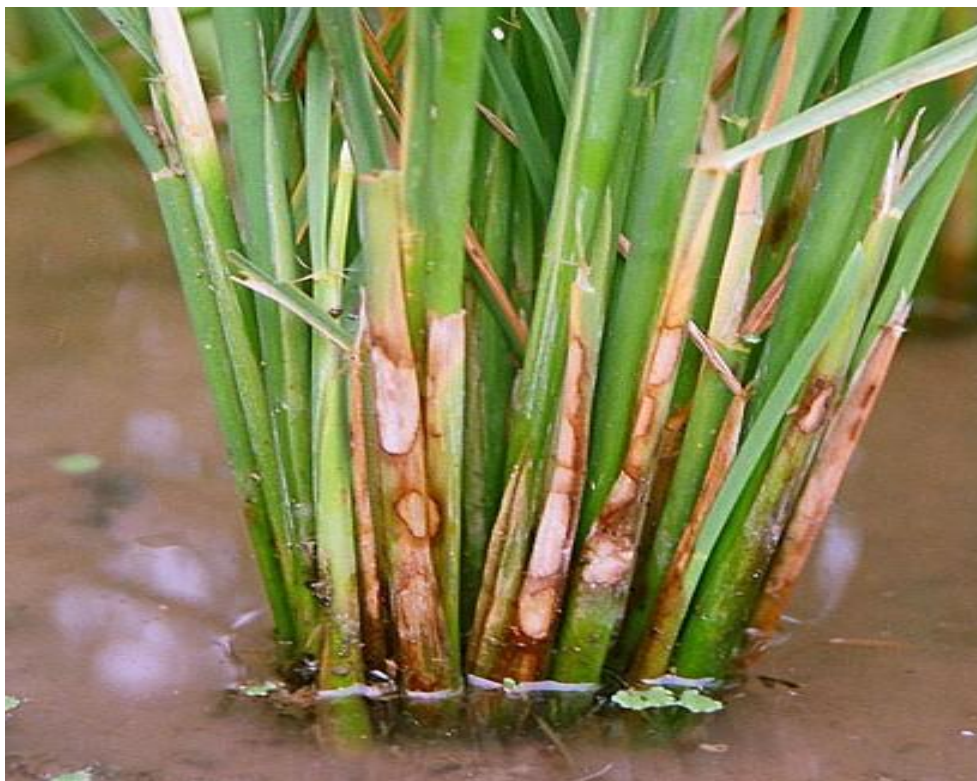
Fig 4: Sheath blight of rice