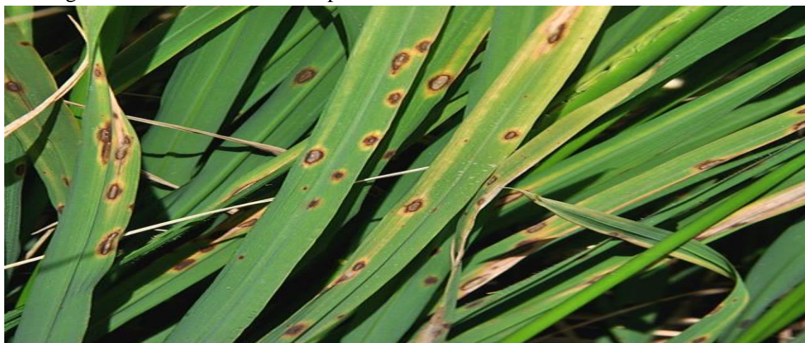
Fig 3: Brown spot of rice