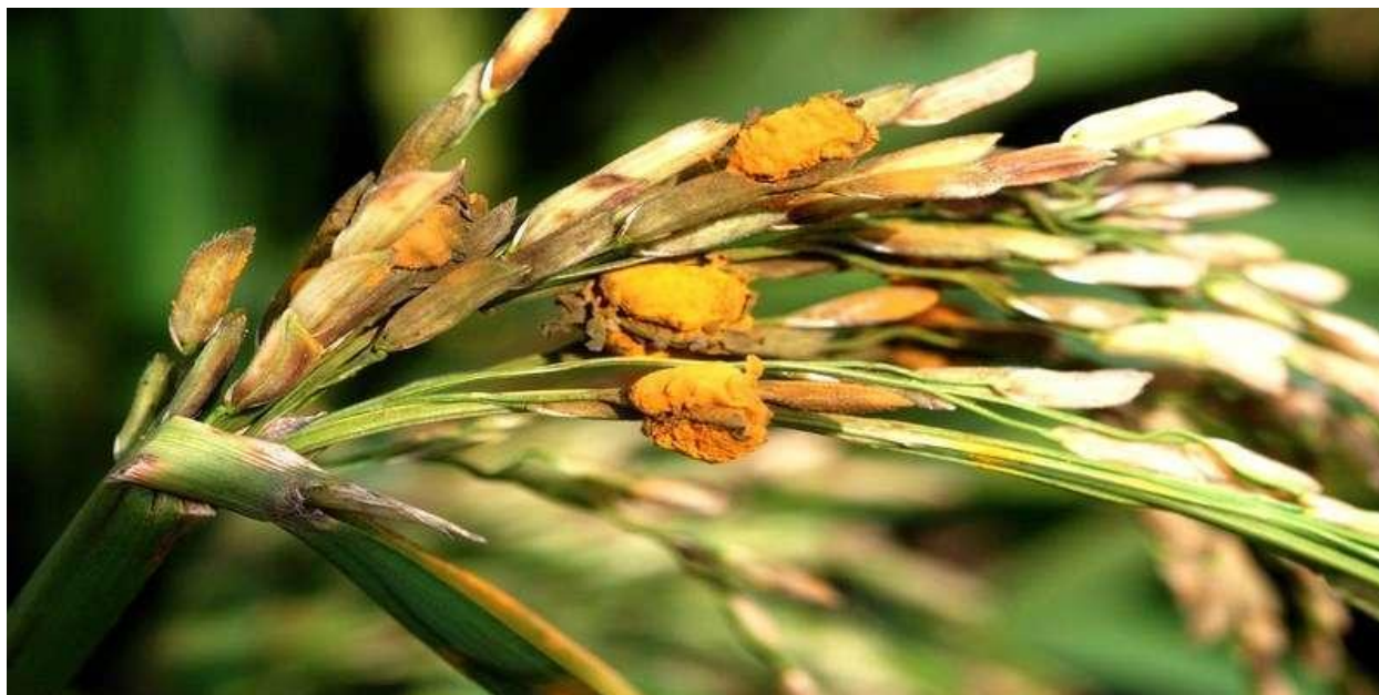
Fig 5: False smut of rice