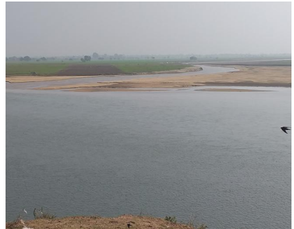
नर्मदा व दुधी नदी संगम

सर्वाधिक भाग मध्य प्रदेश में आता है, और शेष भाग क्रमशः गुजरात, महाराष्ट्र तथा छत्तीसगढ़ में आता है। यह नदी हिमालयी नदियों के समान ग्लेशियरो पर आश्रित नहीं है, वरन् यह अधिकांश रूप अपने बहाव के लिये वनों से निकलने वाली अनेक छोटी – बड़ी सहायक नदियों तथा जल धाराओं के ऊपर तक निर्भर करती है। इसकी प्रमुख सहायक नदियों को बाँये तथा दाँये तट की सहायक नदियों में विभाजित किया गया है, जिनमें बंजर, गौर, शेड, शक्कर, दुधी, गंजल, तवा, तेन्दुनी, बारना, हिरन, ओरसांग, उरी तथा कोलार प्रमुख हैं।