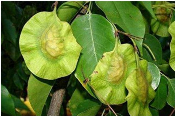
बीजा साल के फ्रूट्स / फल्लिया

यह मूल रूप से भारत, श्रीलंका और नेपाल पायी जाती है। भारत वर्ष में यह प्रजाति मुख्य रूप से मध्य प्रदेश, छत्तीसगढ़, गुजरात, बिहार, उड़ीसा राज्य में पायी जाती है। यह उष्णकटिबंधीय एवं