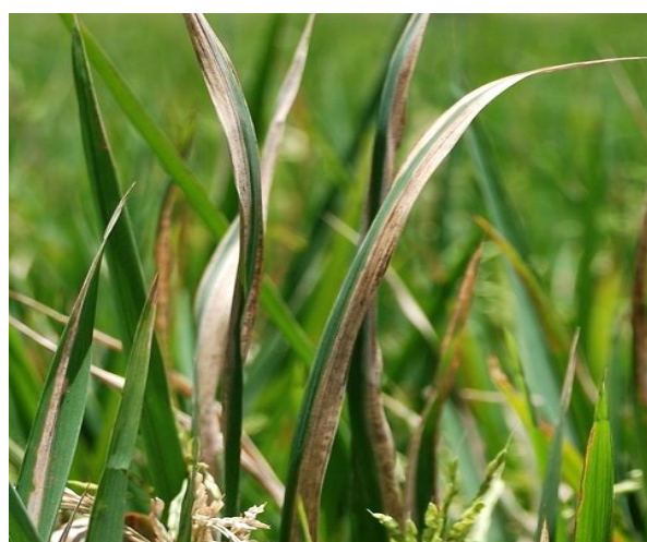
Fig 2: Bacterial blight of rice